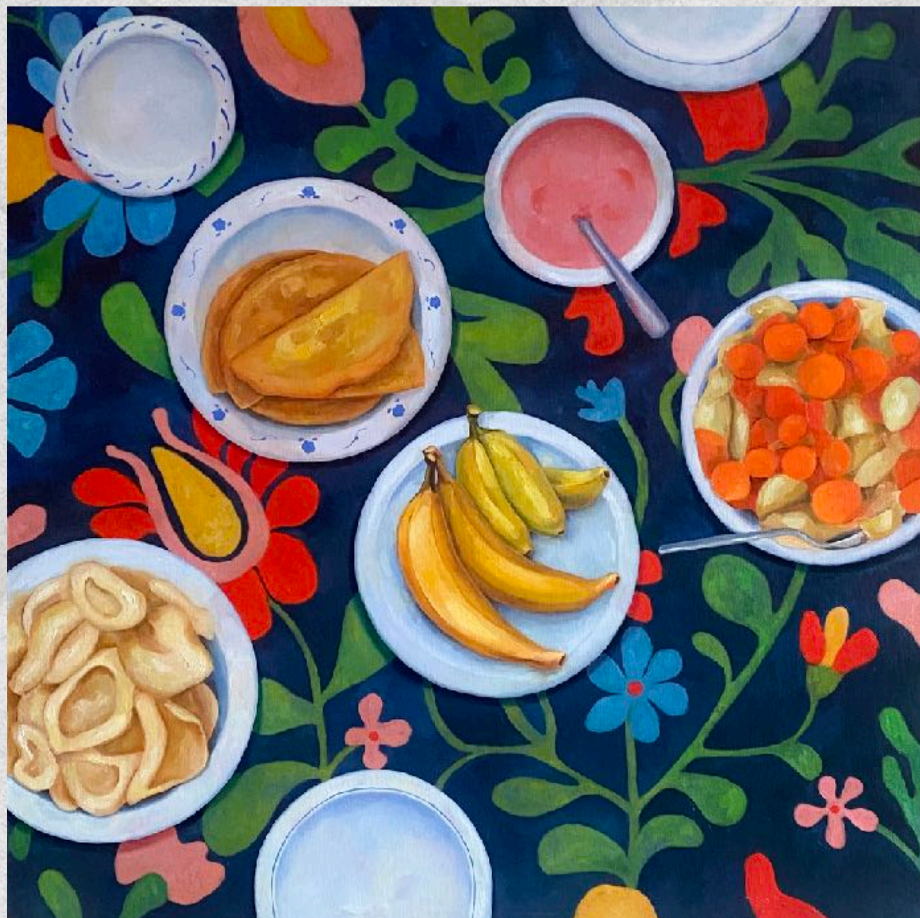
Ужин Холст, масло 80 на 80 см 2024 г.

В индийской культуре приготовление и принятие пищи – один из важнейших элементов жизни, превращающий каждую трапезу в особое событие, связывающее людей с многовековыми традициями.