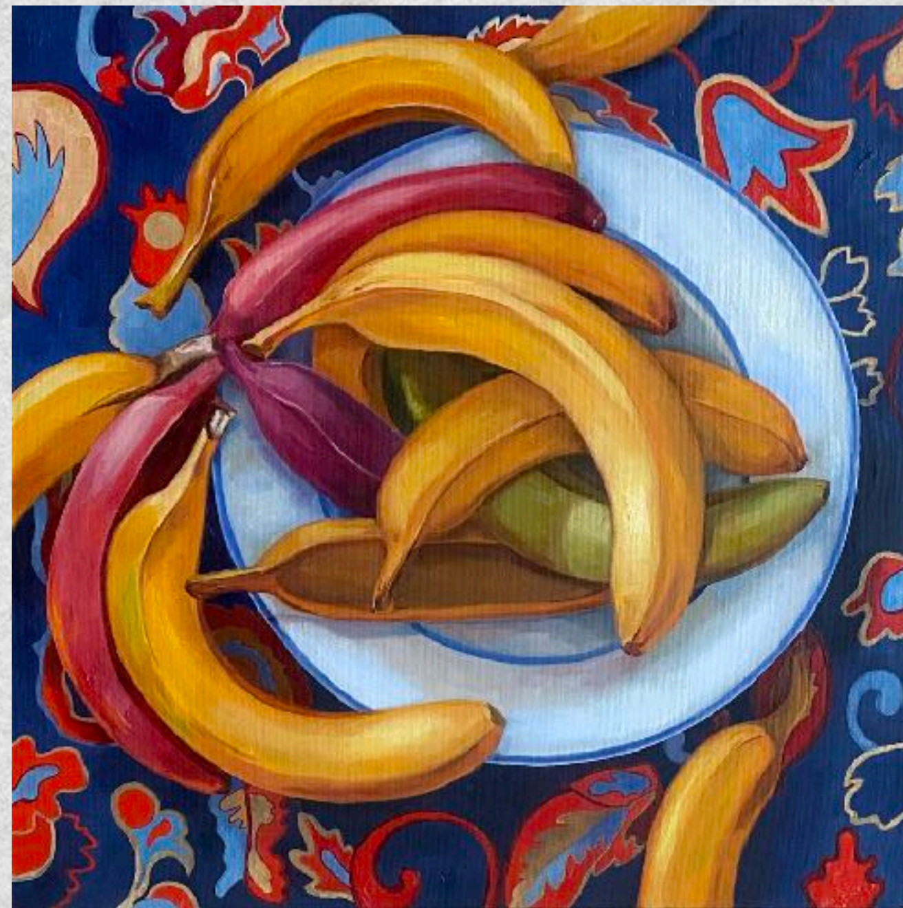
Бананы Холст, масло 40 на 40 см 2024 г.

Среди множества символов Индии особое место занимают бананы – золотистые плоды, наполняющие улицы городов своим присутствием. Они повсюду: в корзинах уличных торговцев, на алтарях храмов, в руках прохожих. Каждый сорт уникален: от крошечных сладких до внушительных плантанов для готовки.