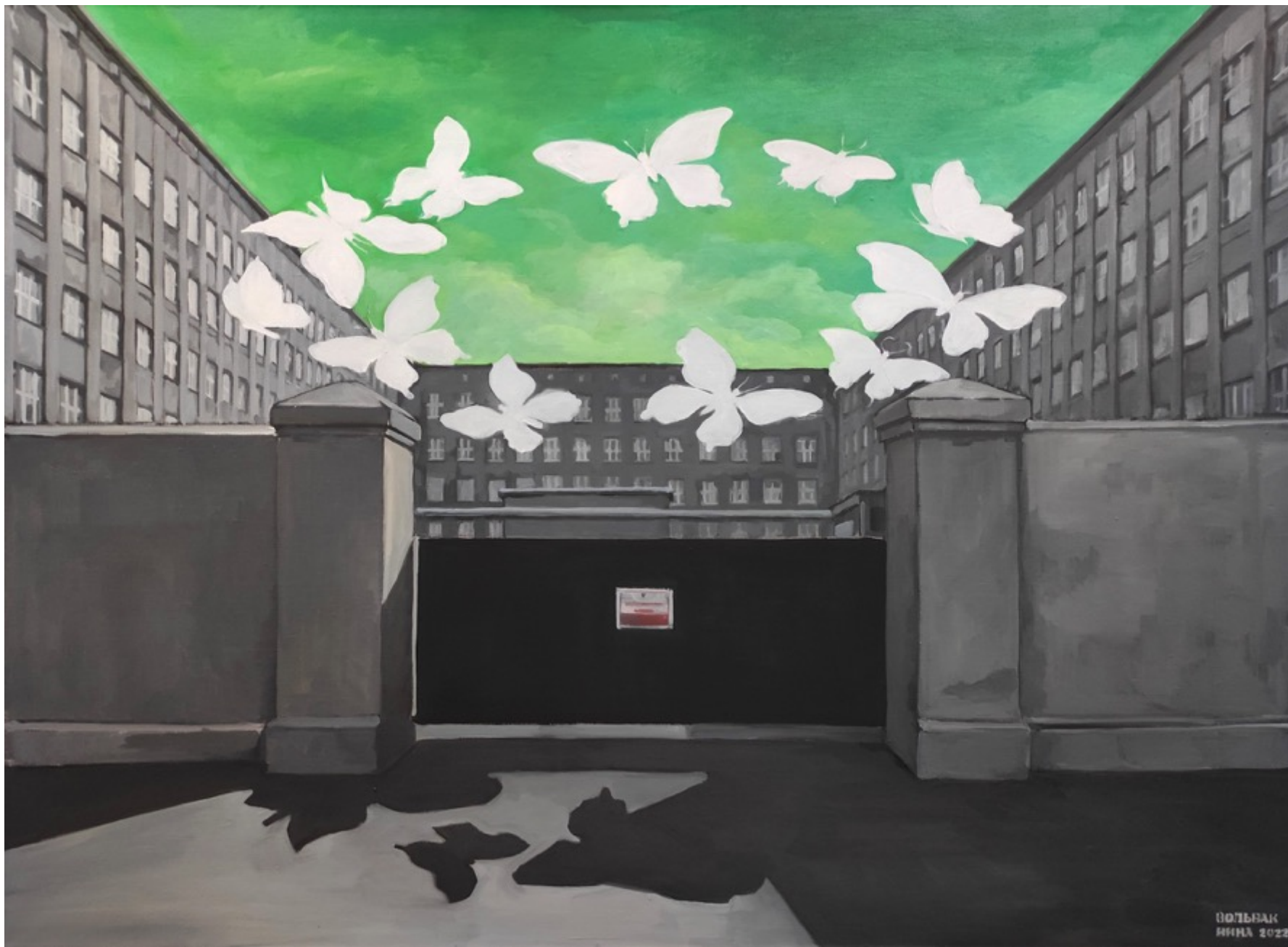
«Бабочек. net» холст, масло, 80x110 см, 2020