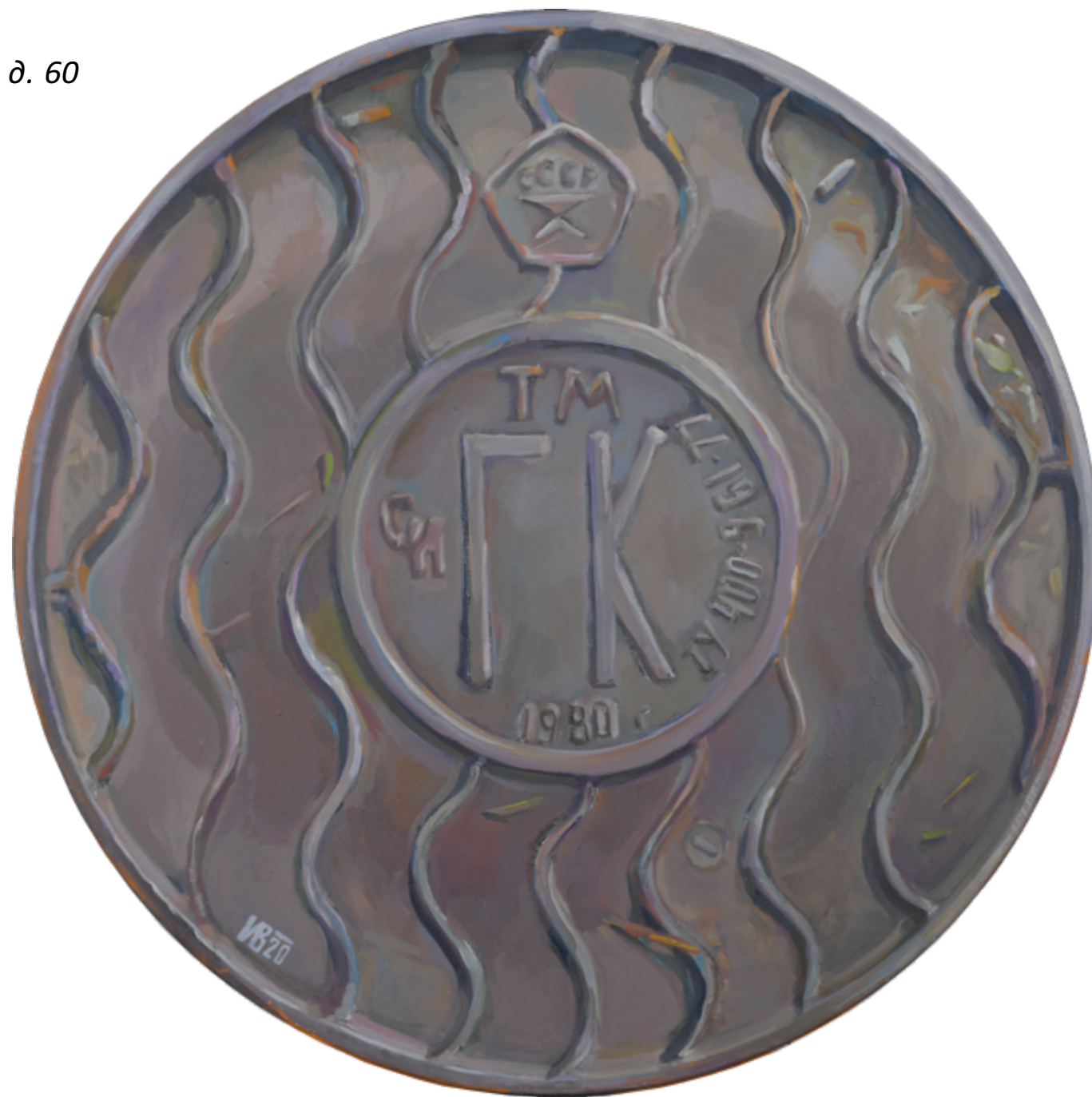
«Люк ГК 1980» холст, масло, д. 60 см, 2020