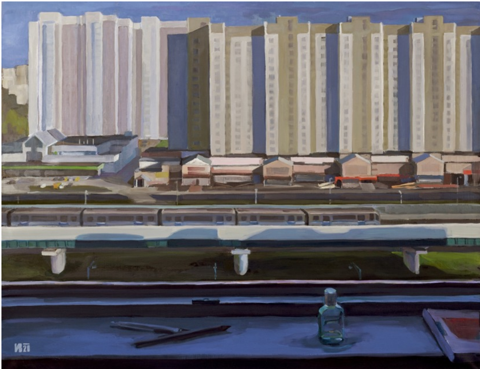
«Самоизоляция. Вечер» холст, масло, 70х90 см, 2020