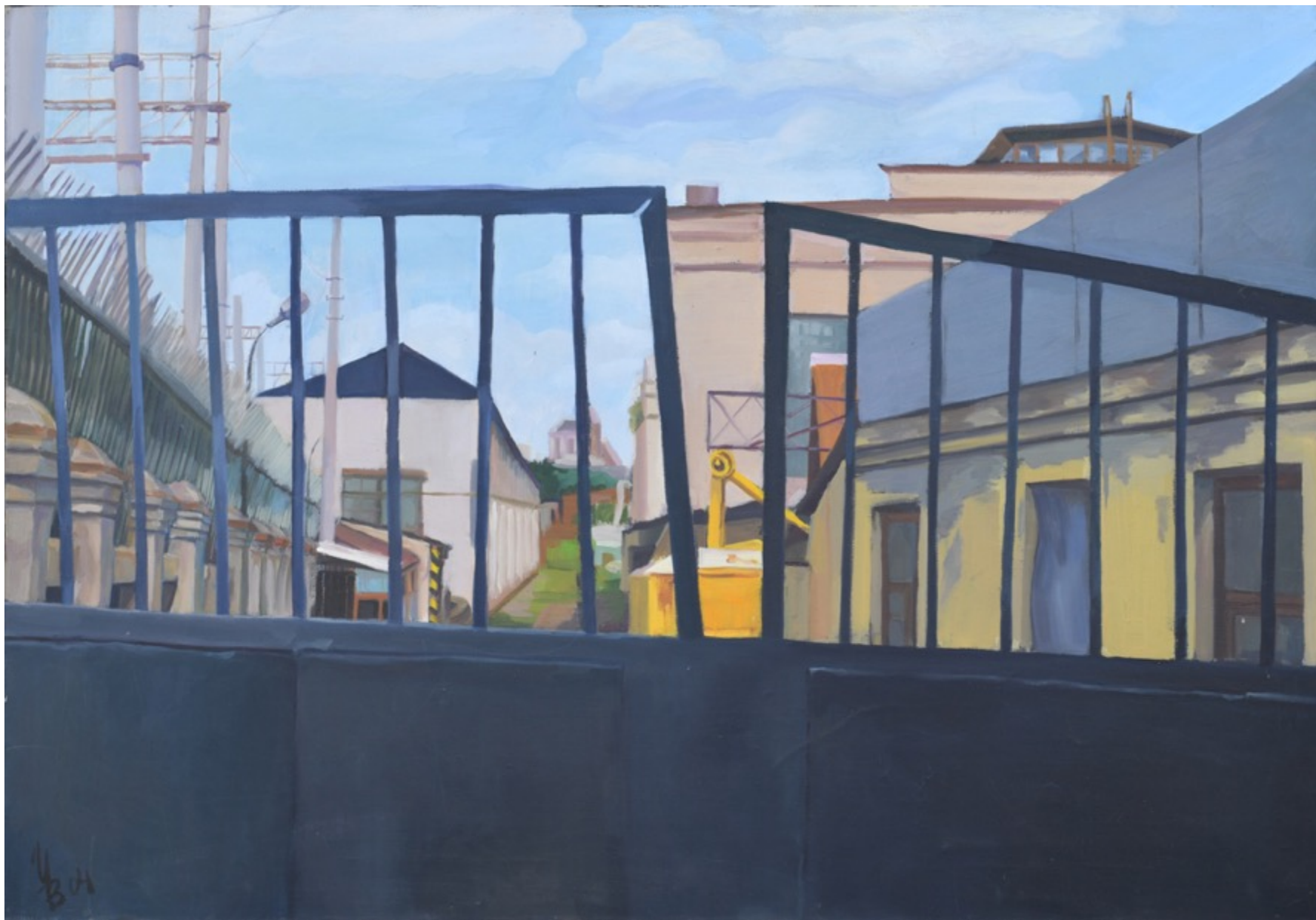
«Ворота» холст, масло, 70x100 см, 2004