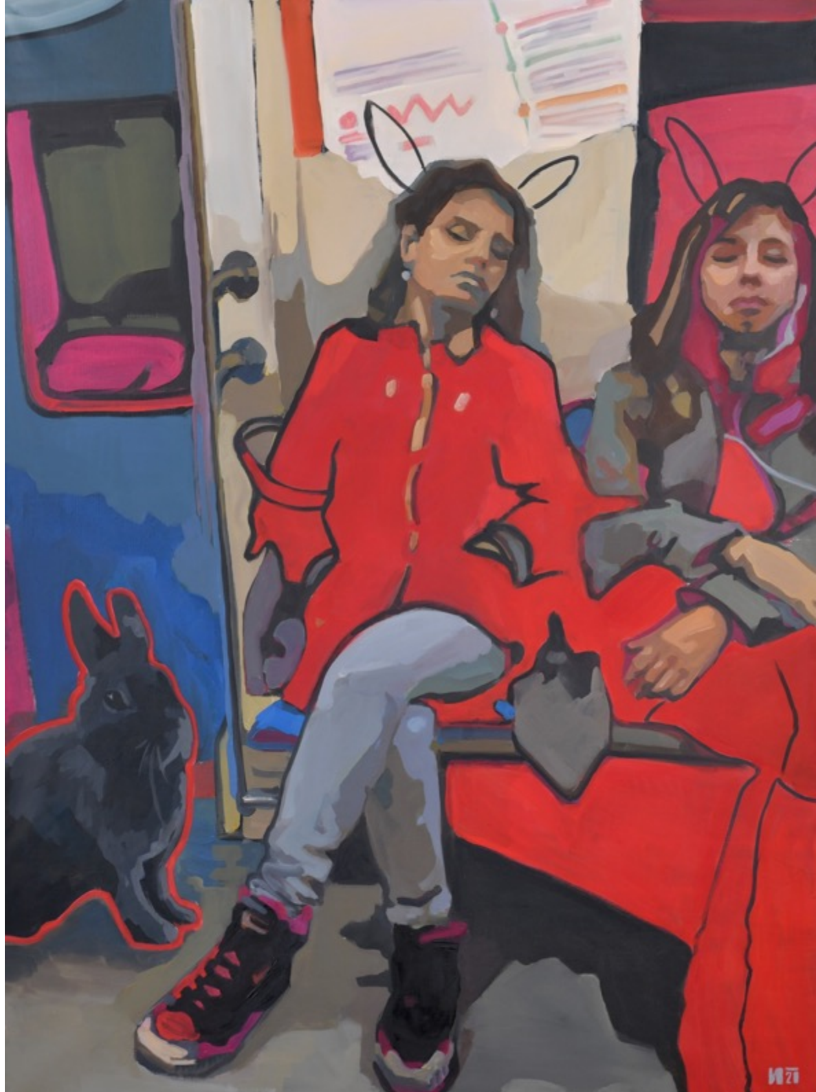
«Что я о вас думаю?» холст, масло, 110x80 см, 2020