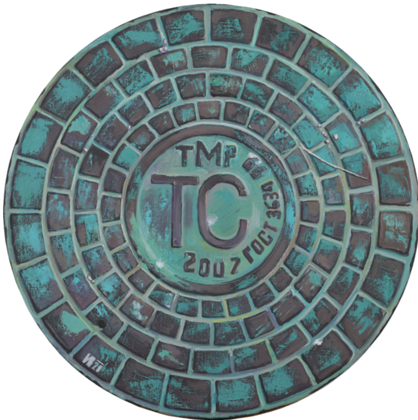
«Люк зеленый ТС 2007» холст, масло, д. 60 см, 2020