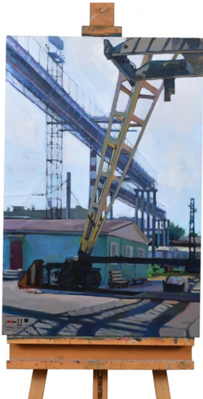
«Кран» холст, акрил, 90х60 см, 2017