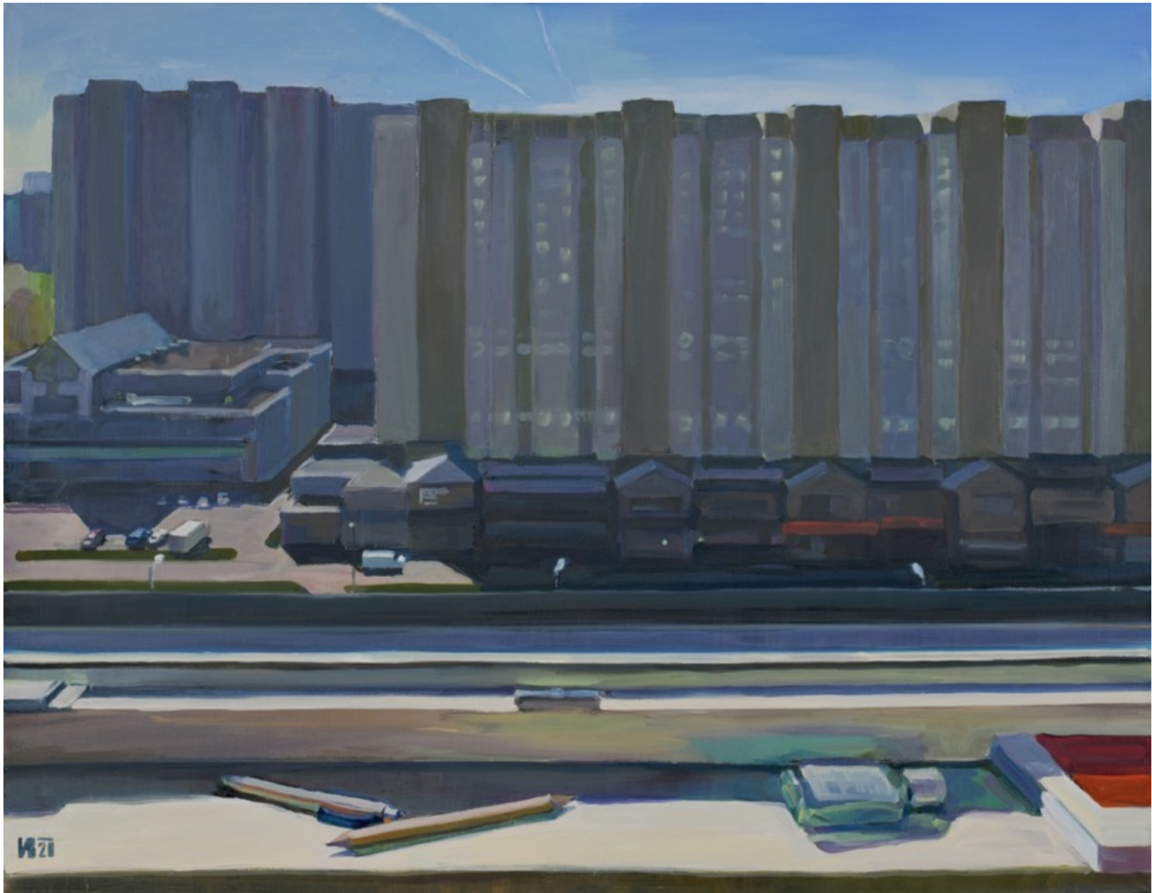
«Самоизоляция. Утро» холст, масло, 70х90 см, 2020