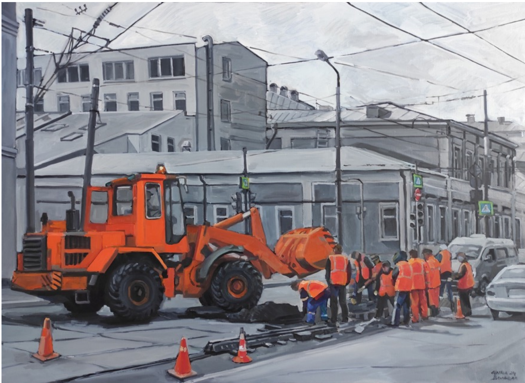
«Замена трамвайных путей» холст, масло, 80x110 см, 2024