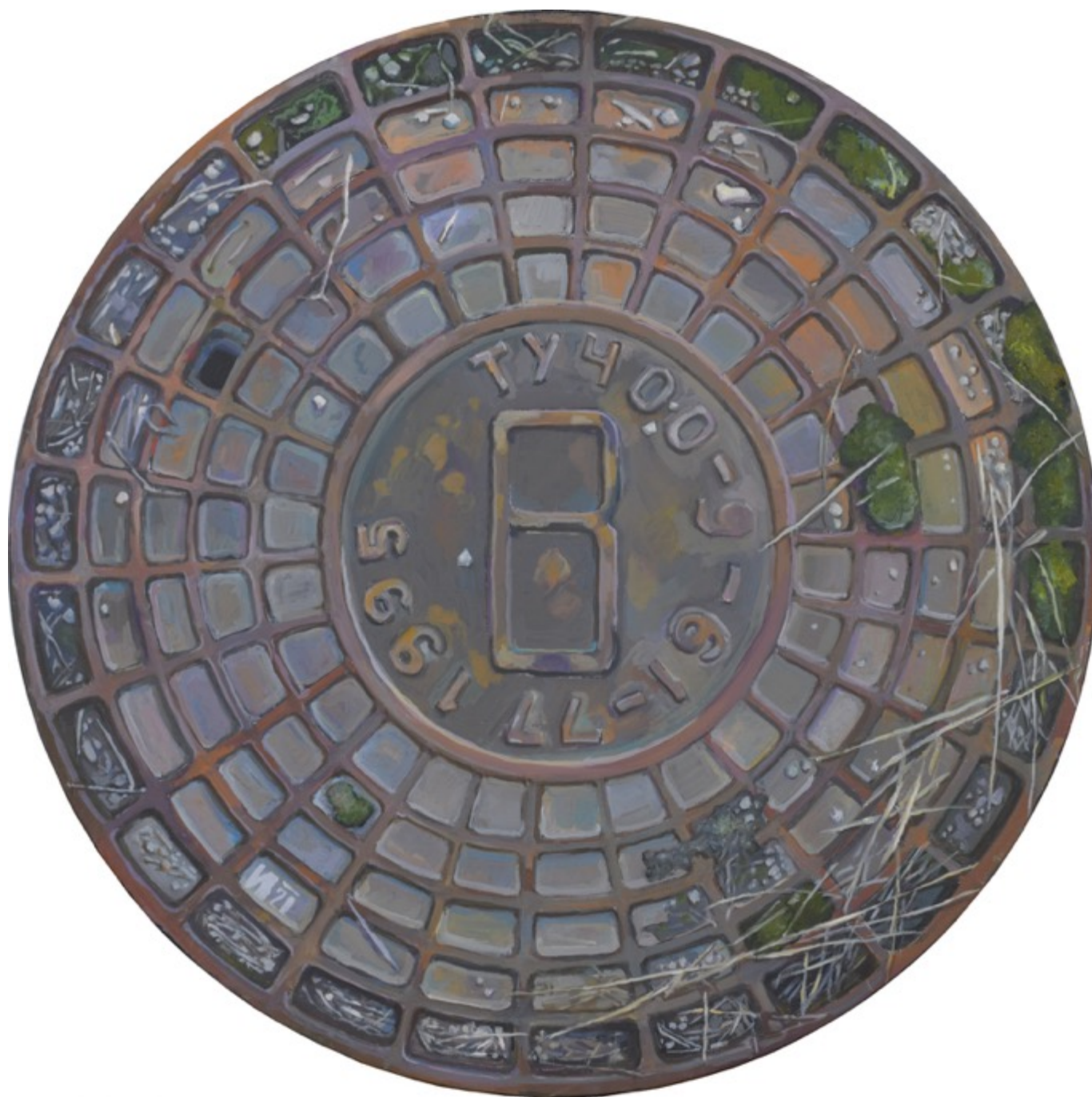
«Люк в траве 1995» холст, масло, д. 60 см, 2020