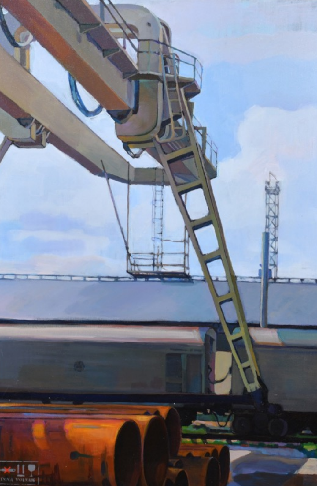
«Трубы» холст, акрил, 90х60 см, 2017