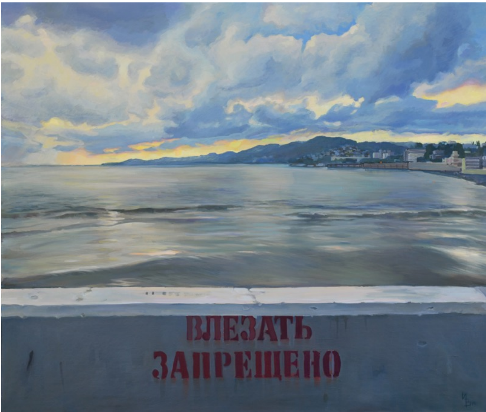
«Влезать запрещено» холст, масло, 100x120 см, 2019