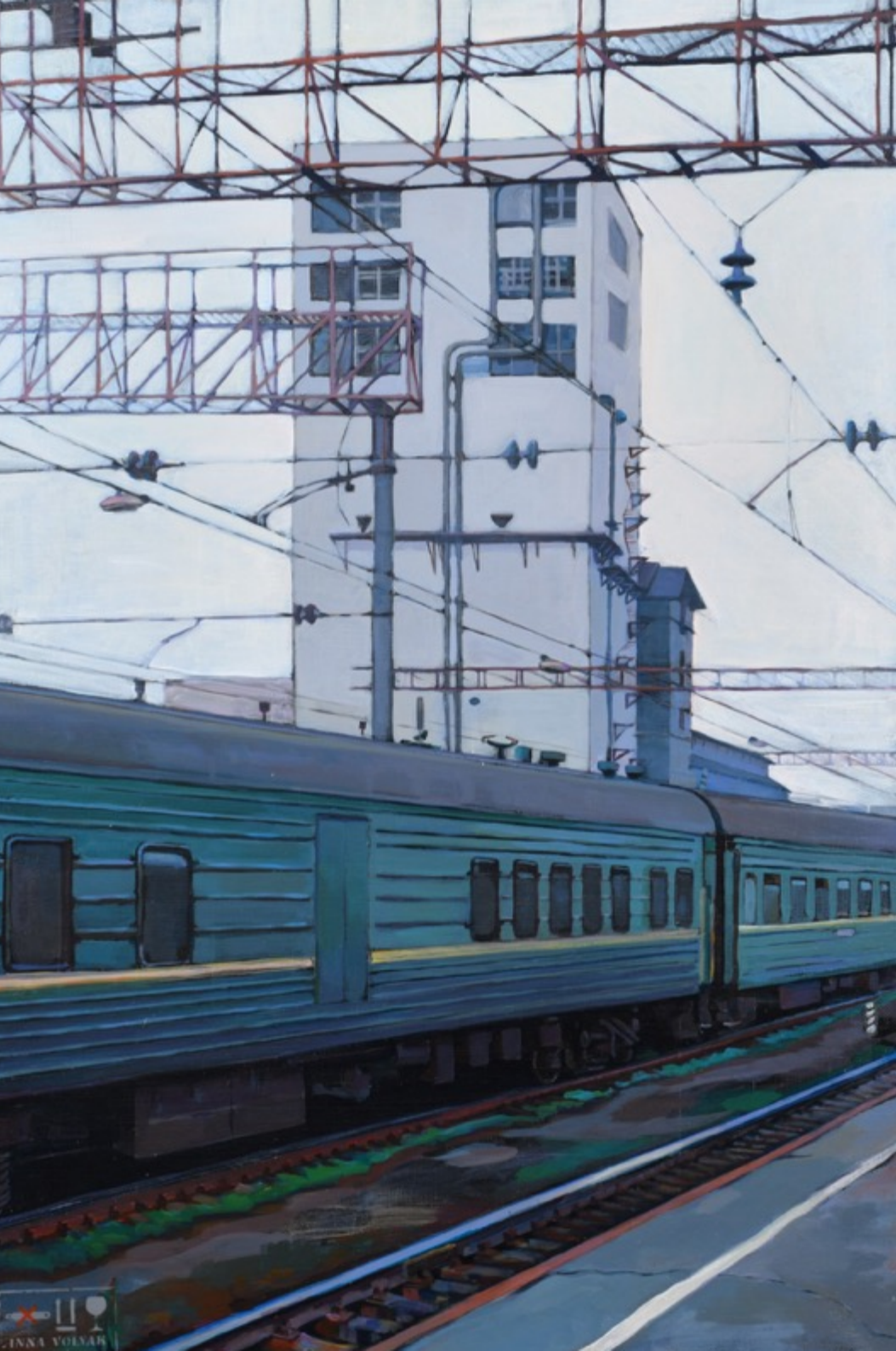
«Элеватор» холст, акрил, 90х60 см, 2017